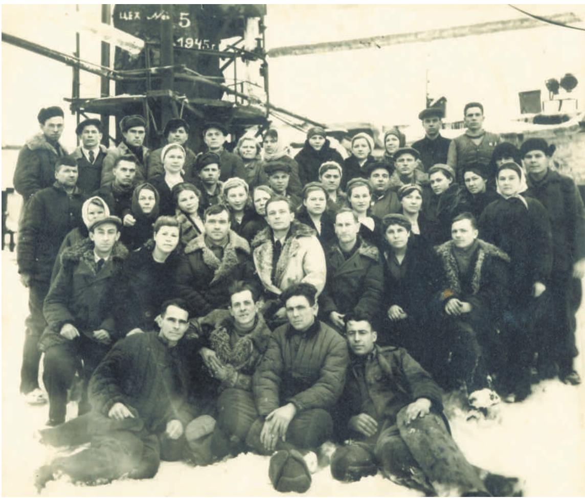
Нефтехимики в труднейших условиях производили нефтепродукты для фронта и промышленности

За годы Великой Отечественной Войны Орский нефтеперерабатывающий завод увеличил выпуск продукции в 2,5 раза. Ассортимент был расширен почти в 5 раз. За героический труд коллектив ОНОСа трижды удостоивался Красного Знамени Государственного комитета обороны СССР, а к 40-летию Победы награжден орденом Отечественной войны I степени.