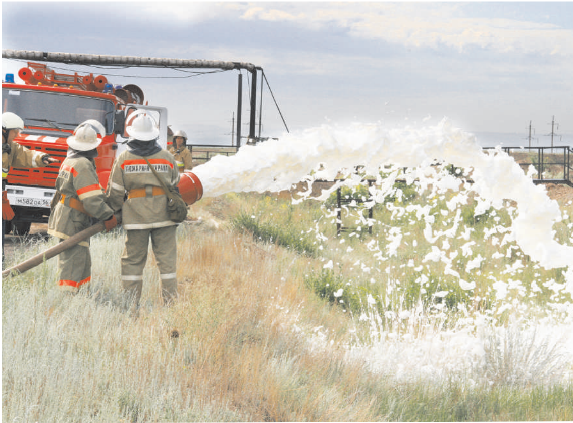
Специалисты ООО «Защита» отрабатывают свои действия во время очередных учений

Для такого пожароопасного объекта, как нефтеперерабатывающий завод, вопрос пожарной безопасности всегда первостепенный, а в период модернизации производства – в особенности. Никому на ОНОСе этого объяснить не надо. Достаточно сказать, что в 2012 году заводом на внедрение автоматических систем обнаружения пожаров было потрачено более 30 миллионов рублей. Круглосуточно на боевом дежурстве находятся семь единиц пожарной техники, еще столько же – в резерве. Автопарк «Защиты» снабжен специальной техникой для тушения в условиях промплощадки: тягачом АТС-59 и автоматическим коленчатым подъемником АКП-30. А уровень цифровой оснащённости здесь просто уникален: чего стоит одна только система Интернет-наблюдения за уровнем наполнения нефтепродуктами завод-